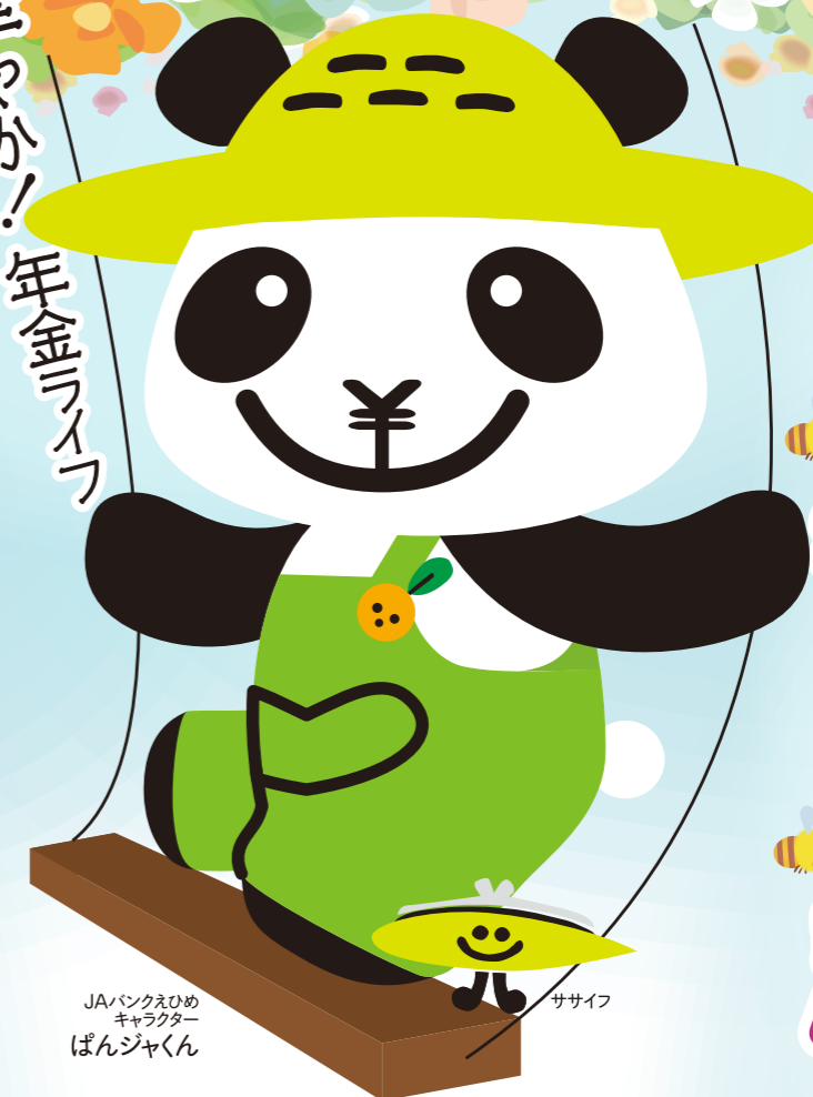
JAバンクえひめキャラクター ぱんじゃくん ササイフ